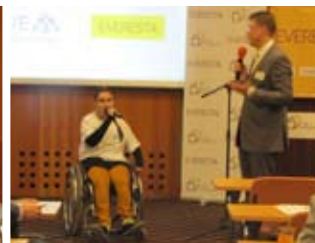
prezentace Ligy vozíčkářů