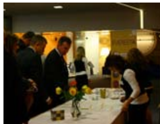
účastníci konference v Praze