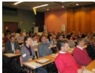
účastníci konference v Brně