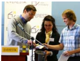
křest knihy "Jak komunikovat s různými typy lidí"