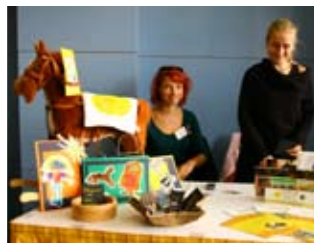
sdržení ZAJÍČEK NA KONI